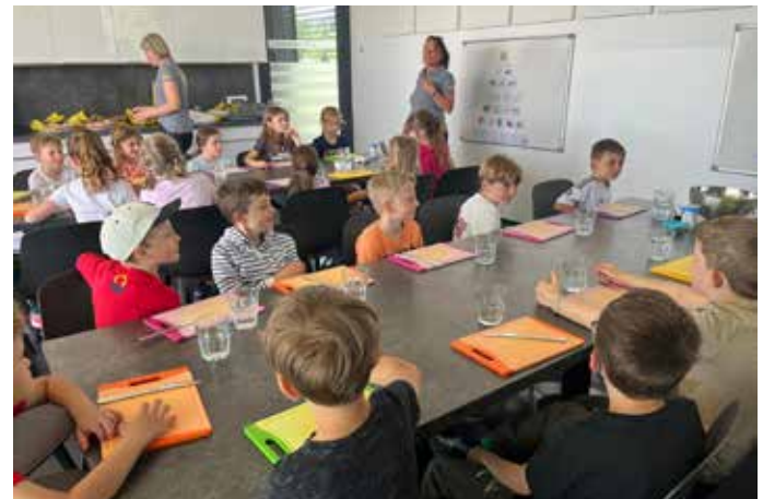
Mobilitätspark: Die ersten Klassen besuchten den Mobilitätspark in Villach. Dort lernten die Kinder das richtige Verhalten am Gehsteig und das sichere Überqueren der Straße. Sie trainierten zudem den Umgang mit Konfliktsituationen. Dann ging es zum Workshop „Gesunde Jause“.