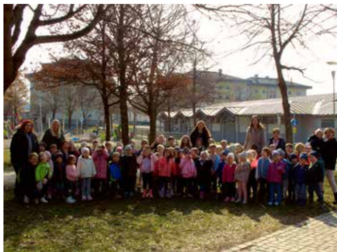
Theater: Ein besonderer Tag für den ganzen Kindergarten – gemeinsam besuchten wir das Theaterstück „Die kleine Maus“ und tauchten in eine spannende Geschichte ein.