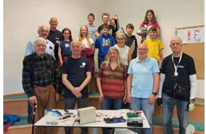
Repair-Café: Die Reparatur-Initiative aus Villach war zu Gast in der Schule. Mit den beiden vierten Klassen wurden kaputte Gegenstände mit Geschick und Teamarbeit repariert. Dabei lernten die Schülerinnen und Schüler, wie wichtig Nachhaltigkeit ist.