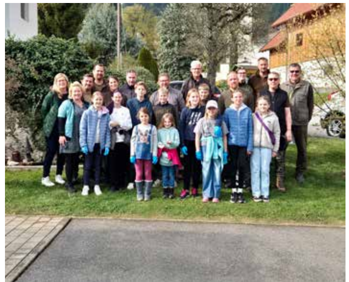
Die Jagdgesellschaft St. Hubertus Wernberg