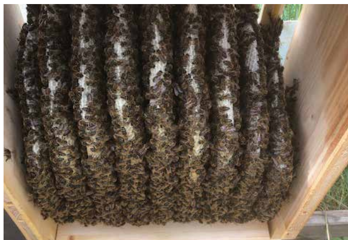
Die „Gottestaler Beute“ mit Bienenschwarm