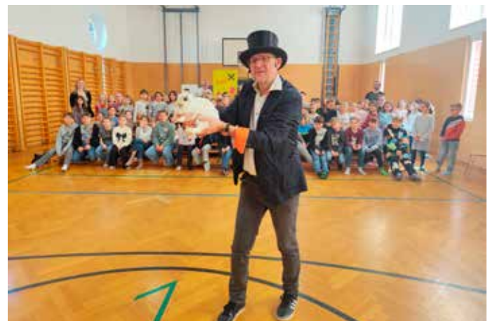
1, 2, 3 – Zauberei: In der Schule herrschte Aufregung, als Zauberer „Zuze“ mit seinem Zauberhut in das Schulhaus kam. Die Schülerinnen und Schüler tauchten in die Welt der Magie ein und hörten gespannt die Geschichte vom kleinen Zauberer „Zuzu“ im Tal der Drachen.