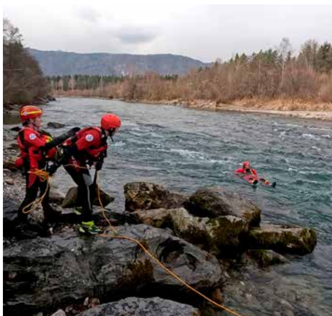
Training: An der Gail stand auch das Schnuppern im Fließwasser auf dem Programm.

Website: www.oewr-kaernten.at/cms/wernberg