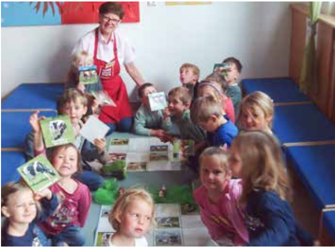
„Kuhle Milch“ für coole Kids: Eine Seminarbäuerin besuchte uns und erzählte den Kindern viel Wissenswertes über den Weg der Milch. Wir machten sogar selbst Butter!