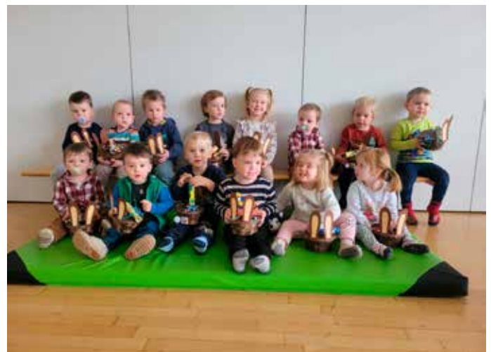
Osternest: Die Kinder gestalteten liebevoll ihre Osternester, die der Osterhase reichlich befüllt hatte, und machten sich anschließend mit großer Freude auf die Suche nach ihren Nestern.