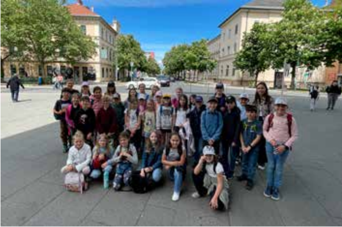
Musikalisch: Unser Schulchor war im Mai in der „KinderMusikUni“ an der Gustav-Mahler-Privatuniversität für Musik in Klagenfurt. In verschiedenen Workshops und einer Abschlussperformance konnten die Kinder in die Welt der Musik eintauchen.