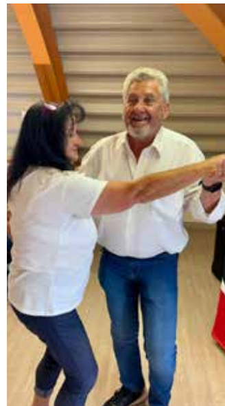
Beim Muttertagskränzchen wurde auch das Tanzbein geschwungen.

Eine Abordnung des Seniorenrings besuchte auch die gelungene 1.-Mai-Feier am Gemeindevorplatz, organisiert von der Schuhplattlergruppe D' Almrauschbuam Umberg/Wernberg, ehe der Seniorenring am 9. Mai sein jährliches Muttertagskränzchen mit Live-Musik im Feuerwehrhaus Wernberg veranstaltete.