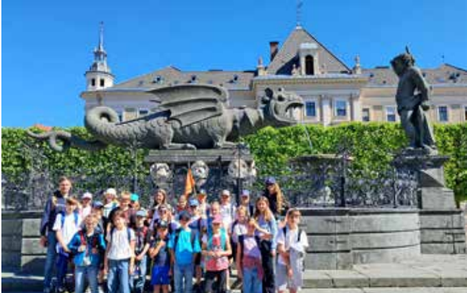
Landeshauptstadt: Die beiden vierten Klassen machten Klagenfurt unsicher. Auf dem Programm standen Besuche der Fuchskapelle in der Stadtpfarrkirche St. Egid und des historischen Wappensaals im Landhaus. Danach spazierten die Kinder zum Lindwurm, dem Wahrzeichen der Stadt.