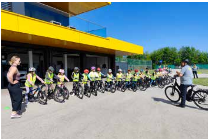
ÖAMTC: Die Kinder der zweiten Klassen machten sich auf den Weg zum ÖAMTC-Fahrsicherheitszentrum in Villach. Dort trainierten sie das sichere Fahrradfahren und lernten wichtige Maßnahmen der Ersten Hilfe. Am Ende des Tages waren sie wahre Meister auf zwei Rädern.