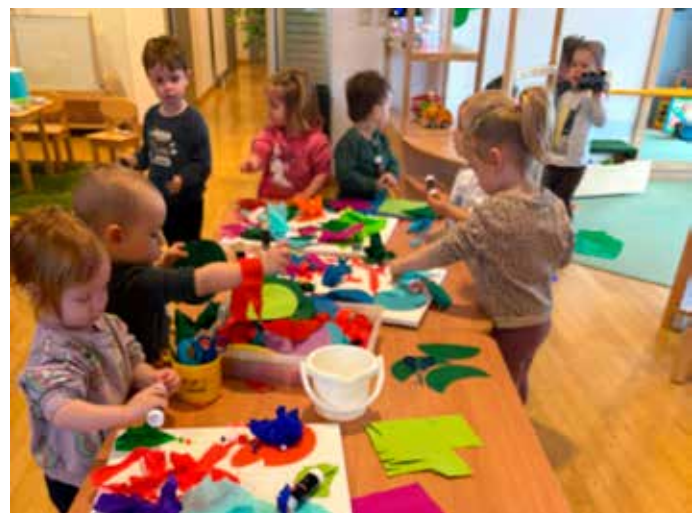
Kreativität: Mit großer Begeisterung ließen die Kinder ihrer Kreativität freien Lauf und hatten viel Freude am Experimentieren mit Kleber, Scheren und verschiedensten Papieren.