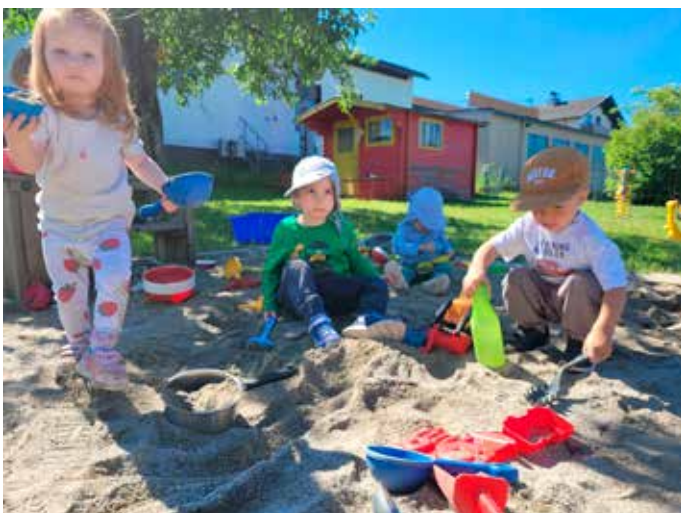
Sonne: Die Kinder aus der Kindertagesstätte Wernberg lieben den strahlenden Sonnenschein und genießen ihre Zeit im Garten beim Schaukeln, Klettern, Laufen und Spielen im Sand.