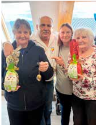
Erfolgreiche Ostereiersuche im Feuerwehrhaus Wernberg

Ob Geburtstagsfeier, Ostereiersuche, 1.-Mai-Besuch oder Muttertagskränzchen – beim Seniorenring Wernberg ist immer etwas los.