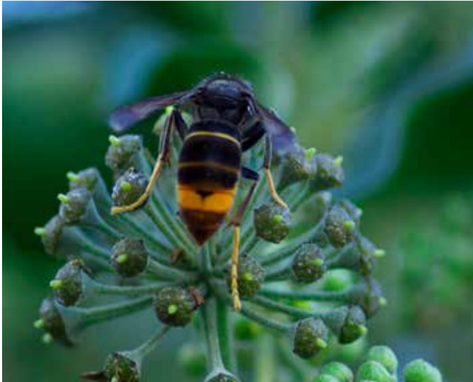
Die Asiatische Hornisse „Vespa velutina“