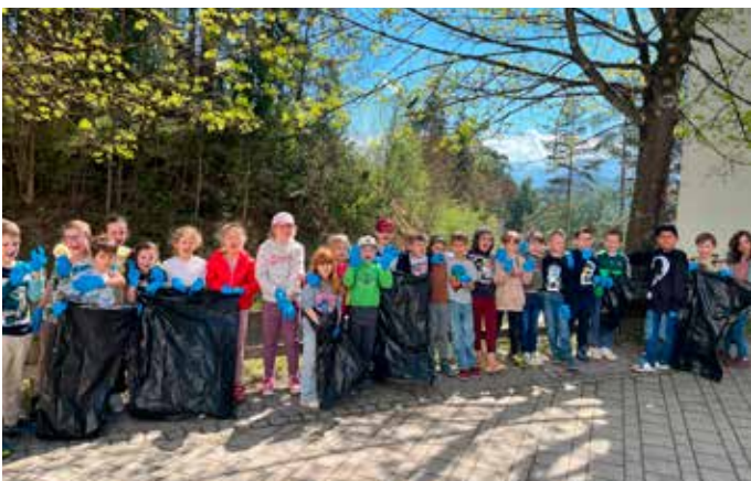
Flurreinigung: Die ersten Klassen beteiligten sich an der Flurreinigungsaktion der Gemeinde Wernberg. Ziel war es, die nähere Umgebung der Schule von achtlos weggeworfenem Müll zu befreien, ein Zeichen für den Umweltschutz zu setzen und das Umweltbewusstsein der Kinder zu stärken.