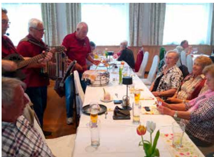
Geselliges Beisammensein im Gasthaus Weberwirt in Prebl