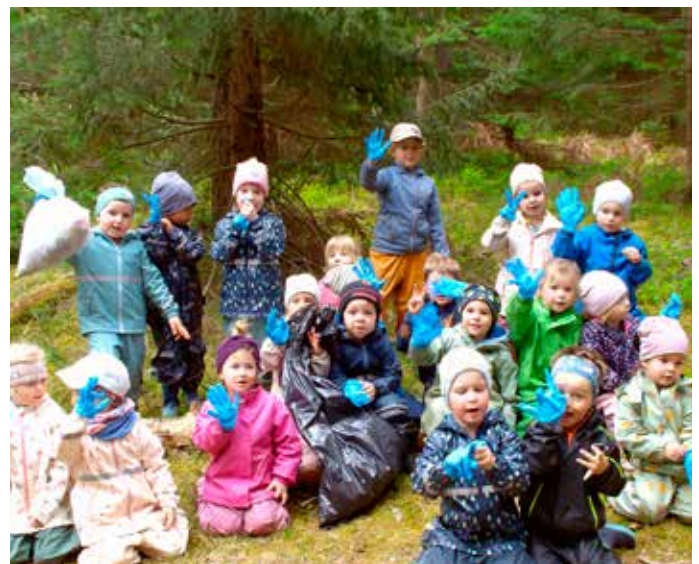
Der Kindergarten Goritschach