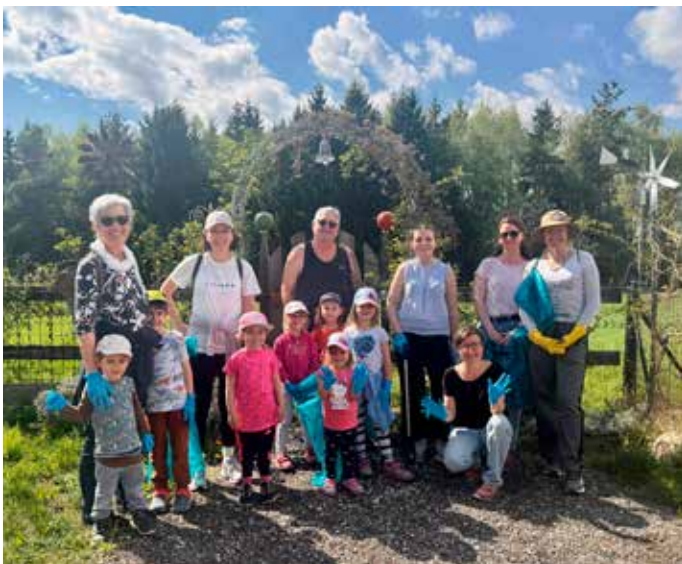
Die Erneuerbare Energiegemeinschaft Förderlach