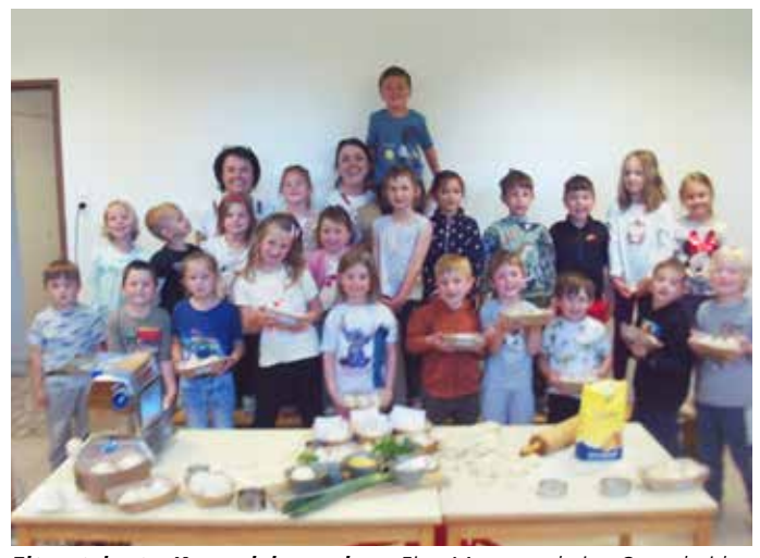
Elterntalent – Kasnudeln machen: Eine Mama und eine Oma, beide Kasnudel-Expertinnen, statteten uns im Zuge der Elternkooperation einen Besuch ab. Gemeinsam mit den Kindern wurden Kärntner Kasnudeln gemacht.