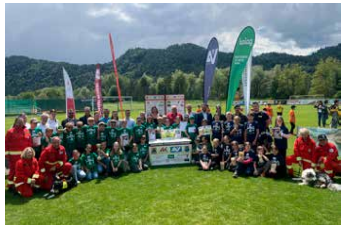
Erfolgreich: Unsere beiden vierten Klassen nahmen hoch motiviert am Bezirksfinale der Kinder-Sicherheitsolympiade teil. Mit viel Wissen, Geschicklichkeit und starkem Teamgeist erreichten sie den hervorragenden 4. Platz (4A) und den großartigen 2. Platz (4B).