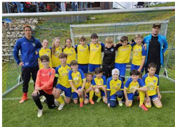
Die erfolgreichen U12-Talente des SV Wernberg