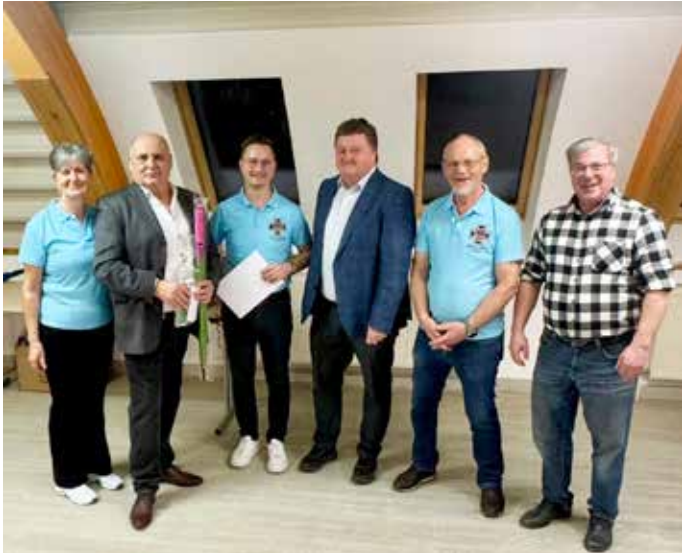
Die Siegerehrung beim Preisschnapsen des Kameradschaftsbundes

Der Ortsverband Wernberg des Österreichischen Kameradschaftsbundes feiert heuer mit vielen Aktivitäten sein 50-jähriges Bestehen.