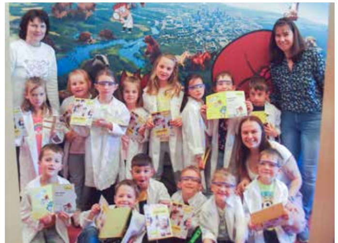
Kleine Forscher: Unsere angehenden Schulkinder besuchten das MINT-Labor in Villach. Dort machten sie den Werkzeugführerschein, experimentierten und forschten.