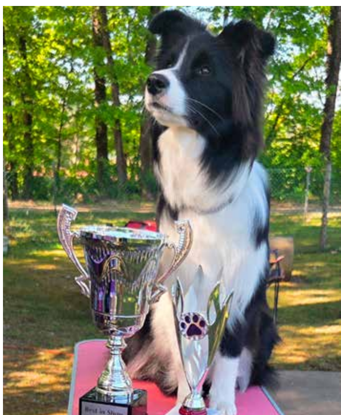
Ein prämierter Border Collie

Die Besitzerinnen und Besitzer dieser Rassen, die ursprünglich zur Unterstützung der Hirten sowie zum Treiben und Zusammenhalten von Schafherden gezüchtet wurden, freuten sich über hervorragende Bewertungen und zahlreiche Pokale.