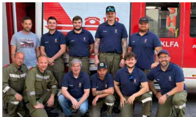
Die erfolgreichen Kameraden der Feuerwehr Wernberg