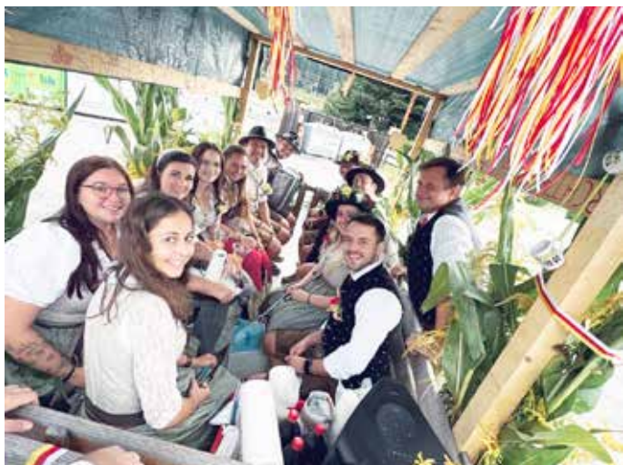
Kirchtagsladen: Traditionell ziehen die Mitglieder der Zechgemeinschaft Föderlach auch heuer wieder durchs Dorf.