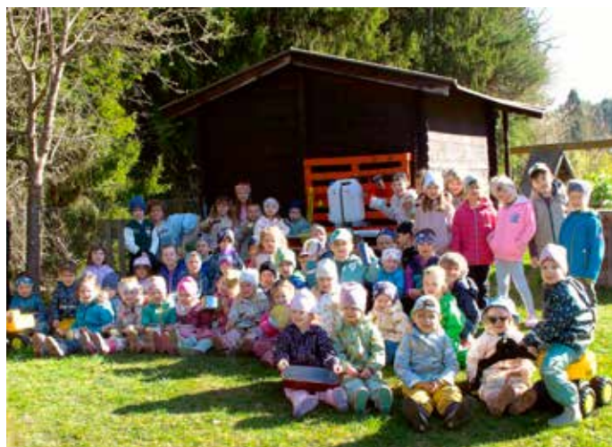
Ostern: Während der Osterferien baute der „Osterhase“ im Kindergarten eine Matsch- und Gatschküche! Jetzt gibt es ganz viel Hexensuppe, Kräuterschleim und Sandkuchen zum Essen.