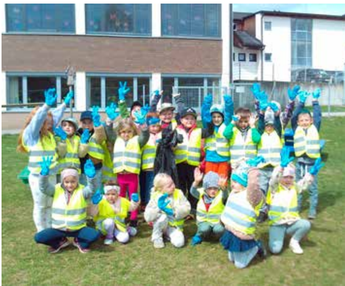
Der Kindergarten Damtschach