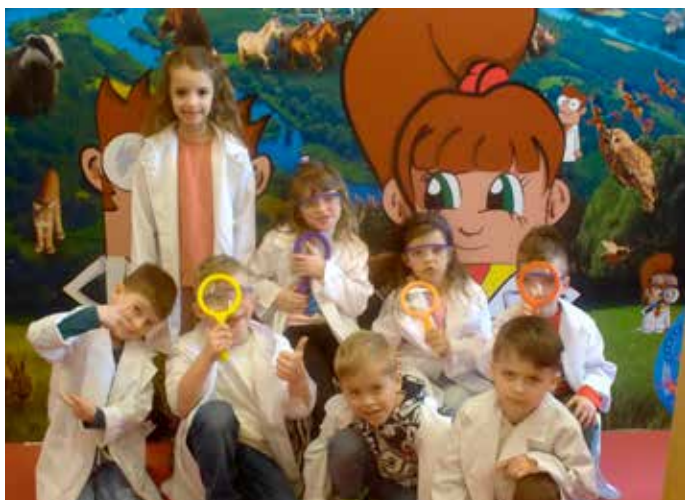
MINT: Die „Eulenkinder“ fahren mit dem Bus nach Villach. Im Mini Educational Lab im Technologiepark stand Forschen und Experimentieren auf dem Programm.