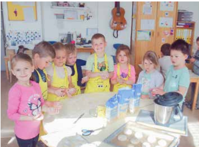
Kleine Bäcker: Unsere „Eulenkinder“ zauberten leckere Weckel für unseren Elternabend. Mit viel Freude und Eifer kneteten, formten und backten sie die Köstlichkeiten selbst.