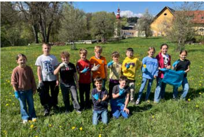
Fleißig: Ein Fixpunkt im Frühjahrsprogramm ist die alljährliche Flurreinigung, zu der die Gemeinde Wernberg aufruft. Unsere Schülerinnen und Schüler beteiligten sich mit großem Engagement daran und sammelten fleißig achtlos weggeworfenen Müll ein.