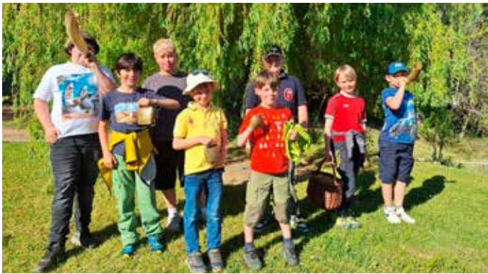
Die Buben der Dorfgemeinschaft Ragain pflegten wieder das Georgijagen.