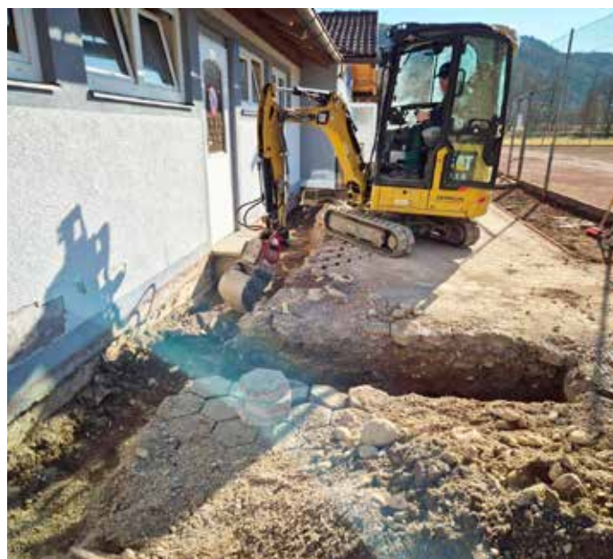
Auch der Bagger rollte bei den Sanierungsarbeiten an.

Online-Tipp: Aktuelle Informationen und Neuigkeiten finden Sie auf der Website des Vereins ( www.tc-wernberg.at ).