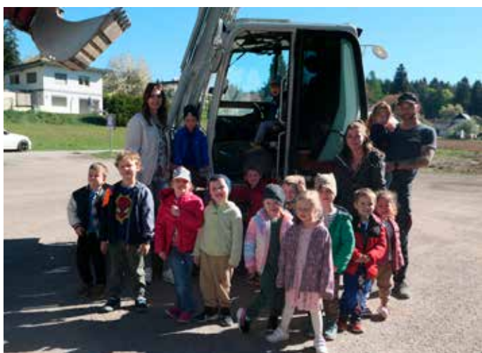
Elternkooperation: Im Zuge der Elternkooperation besuchten uns Eltern mit einem Bagger und einem Sattelschlepper. Nach einer Besichtigung gab es eine Überraschung aus der Baggerschaufel.