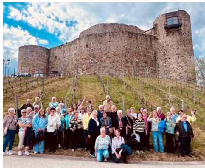
Die Ausflugsgruppe vor der Burg Taggenbrunn

Obmann des Pfarrgemeinderates, freute sich über die große Beteiligung. In der Wehrkirche von Diex wurde eine Messe gefeiert, ehe sich die Gruppe bei einem Mittagessen im Gasthaus Leitgeb in Grafenbach stärkte. Danach ging es weiter zur Burg Taggenbrunn, wo der Ausflug bei Kaffee und Cremeschnitten gemütlich ausklang.