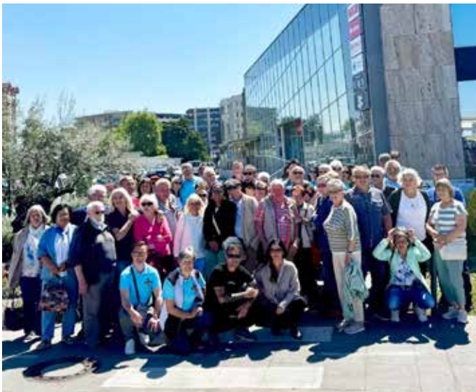
Beim Frühjahrsausflug führte die Reise heuer nach Koper

Ein weiterer Höhepunkt steht bereits bevor: Am Samstag, dem 11. Juli, findet ab 10.00 Uhr das große Jubiläumsfest am Festplatz der Gemeinde statt. Alle Vereine, Feuerwehren, Einsatzorganisationen sowie die Bevölkerung sind herzlich eingeladen, gemeinsam das 50-jährige Bestehen des Kameradschaftsbundes in Wernberg zu feiern.