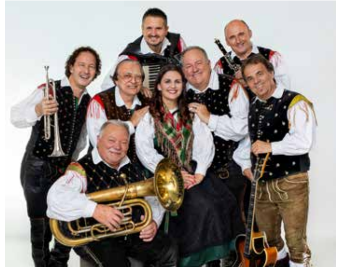
10. Juli 2026: Jubiläumskonzert „60 Jahre Alpenoberkärner“

nen, aber vor allem leicht zu begehenden Weg anzusehen und zum Abschluss im Rosengarten einen Kaffee zu trinken oder ein Erfrischungsgetränk zu