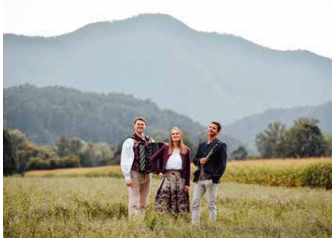
7. August 2026: Konzert des Trios „Wildes Kraut“ mit der Erstaufführung der „Wernberger Klosterlikör“-Polka

genießen. Unser Wanderwegbetreuer Walter Hofer hat sich zudem wieder liebevoll um alle Wanderwege gekümmert.