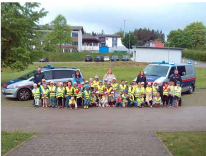
Elterntalent – Polizei zu Besuch: Im Zuge der Elternkooperation hatten wir Besuch von einem Polizisten-Papa. Es war ein spannender und lehrreicher Vormittag.