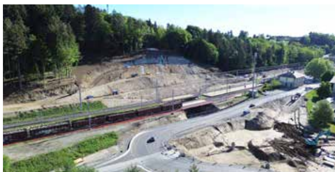
Die Arbeiten bei der Baustelle in Föderlach schreiten zügig voran.

Das Projekt: Die Arbeiten laufen bei vollem Bahnbetrieb seit dem Beginn der Vorarbeiten im Oktober 2025. Die Verkehrsfreigabe ist für Ende Juni 2027 geplant. Insgesamt investieren die ÖBB und das Land Kärnten gemeinsam rund 21,5 Millionen Euro in das Projekt.