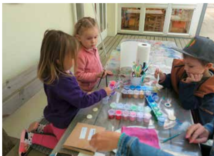
Künstlerin: Mit viel Kreativität und Freude gestalteten die Kinder gemeinsam mit einer künstlerischen Mama liebevolle Ohrhinge und Halsketten für ihre Mamis.