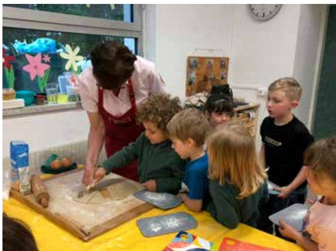
Seminarbäuerin: Mit der Seminarbäuerin entdeckten wir spielerisch, wo unsere Lebensmittel herkommen – und backten gemeinsam köstliche Kipferl.