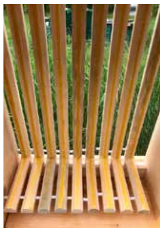
Der Nachbau der „Gottestaler Beute“